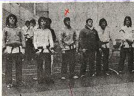
● L'équipe belge victorieuse de la première Coupe Persoons. (Photo William Delva).